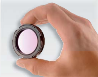
Защитный фильтр для объектива