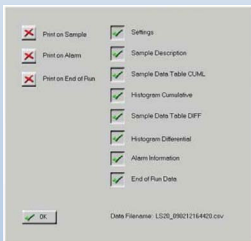
Окно настройки отчётов