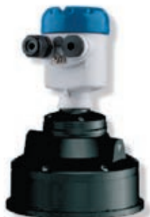
OPTISOUND 3030 C