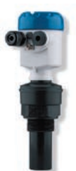
OPTISOUND 3010 C